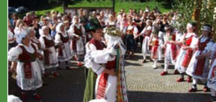
5 - Valašská svatba, folklórní soubor Hafera, Nový Hrozenkov

Půvab Valašska, rázovitost krajiny i obyvatel inspirovala již řadu básníků, spisovatelů, malířů i hudebních skladatelů. Rovněž zde působí taneční a pěvecké soubory uchovávající valašský folklór.