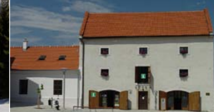
18 - Kulturní informační centrum, Valašské Meziříčí

Nabídka ubytování je u nás velmi rozmanitá. Ubytovat se můžete v penzionech, chatách či chalupách, v rodinných nebo velkých luxusních hotelech. V místních hospůdkách a restauracích můžete ochutnat tradiční valašské pokrmy.