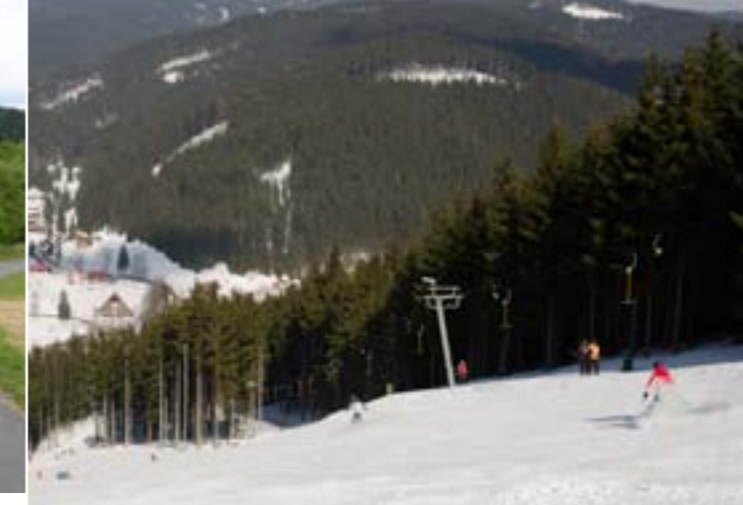
16 - Skiareál Razula, Velké Karlovice