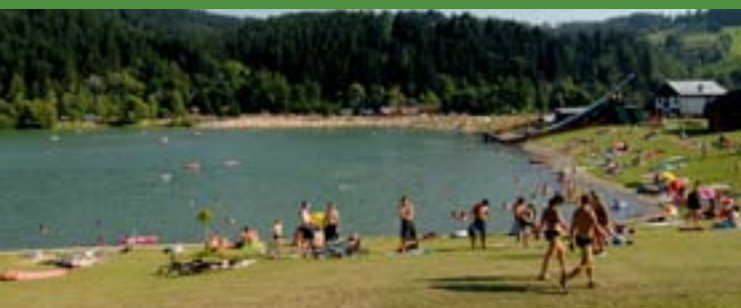
8 - Přírodní koupaliště, Nový Hrozenkov

Nabídka ubytování je u nás velmi rozmanitá. Ubytovat se můžete v penzionech, chatách či chalupách, v rodinných nebo velkých luxusních hotelech. V místních hospůdkách a restauracích můžete ochutnat tradiční valašské pokrmy.