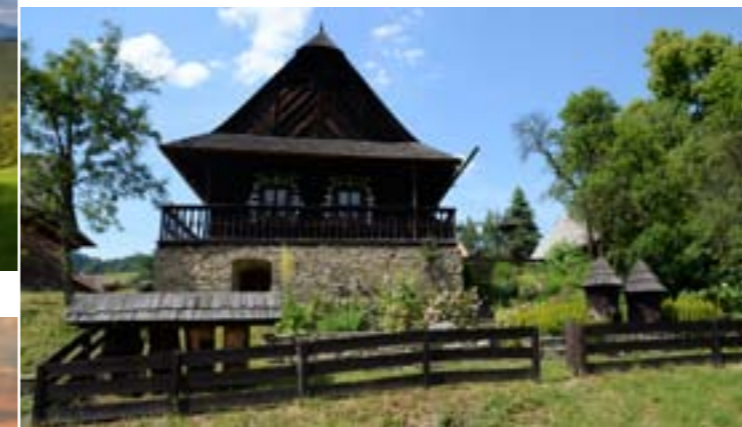
4 - Památník Antonína Strnadla, Nových Hrozenkov

Půvab Valašska, rázovitost krajiny i obyvatel inspirovala již řadu básníků, spisovatelů, malířů i hudebních skladatelů. Rovněž zde působí taneční a pěvecké soubory uchovávající valašský folklór.