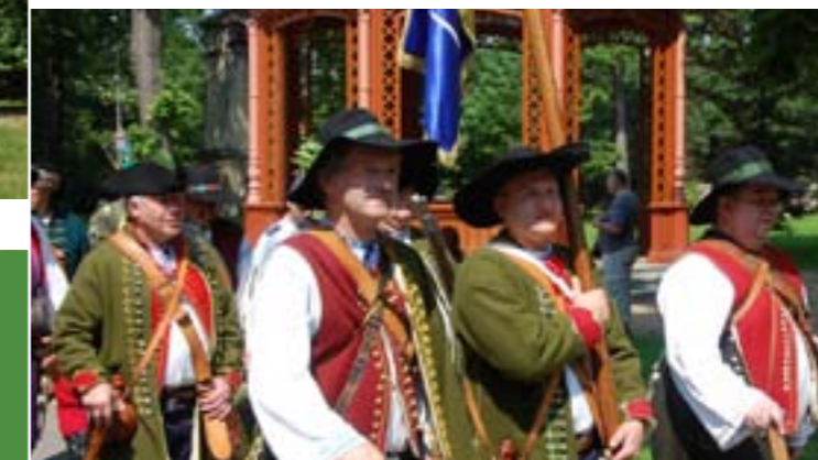
7 - Portášké slavnosti, Valašská Bystřice

V sedmi obcích se nachází turistické informační centrum, a to v Karolince, Novém Hrozenkově, Velkých Karlovicích, Zašové, Valašské Bystřici, Rožnově pod Radhoštěm a Valašském Meziříčí.