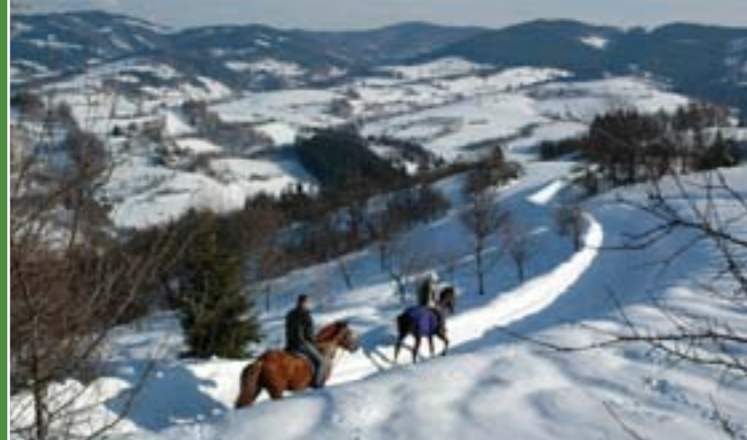
10 - Zimní projížďka Valašskem

Turistická oblast „Valašsko moje“ nabízí velmi dobré podmínky pro aktivní trávení volného času. Právě mimořádně zachovalý krajinný ráz s kvalitní a dostatečnou infrastrukturou cestovního ruchu a svérázná lidová kultura přitahují na Valašsko nejvíce turistů. Ti sem jezdí zejména za cykloturistikou a pěší turistikou, v zimě pak za sjezdovým a běžeckým lyžováním či za výlety na sněžnicích.