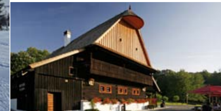
20 - Fojtka, Hutisko-Solanec