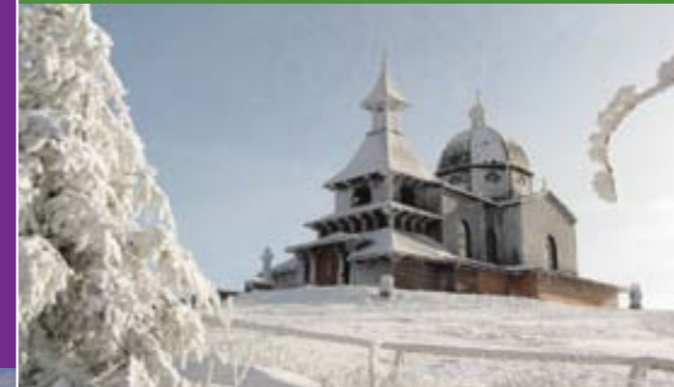
3 - Kaple Cyrila a Metoděje, Radhošť

Naše území je velmi cenné pro své kulturní památky a nachází se zde nespočet památek místního významu s prvky tradiční valašské architektury. Jedná se například o kostely, kapličky, zvonice, muzea a v neposlední řadě také o zachovalé valašské dřevěnice typické pro všechny obce.