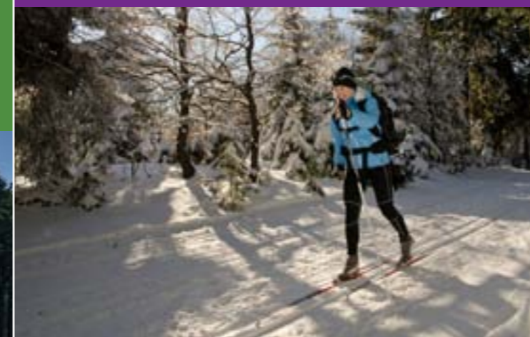
15 - Běžecká stopa na hřebeni Javorníků

Nelze také opomenout návštěvníky velmi oblíbenou Cyklostezku Bečva, která vede údolími Rožnovské a Vsetínské Bečvy.