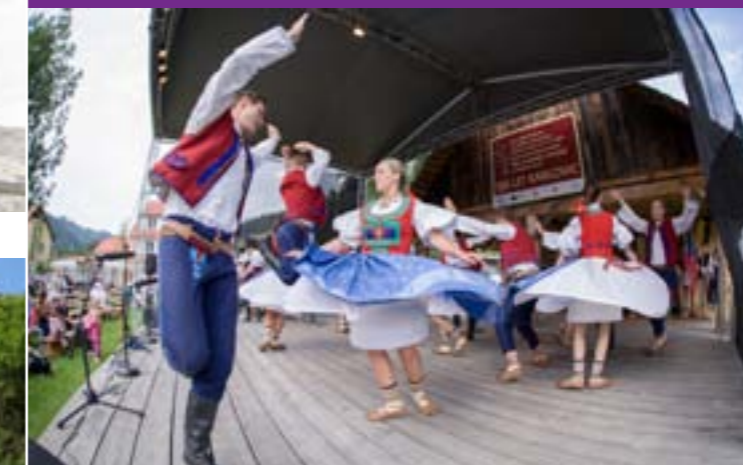
6 - Slavnosti 300 let Karlovic, Velké Karlovice

Celý rok zde panuje čilý kulturní ruch v podobě tradičních kulturních akcí jako jsou jarmarky, poutě, festivaly, koncerty a vystoupení, výstavy, přednášky či divadelní představení.