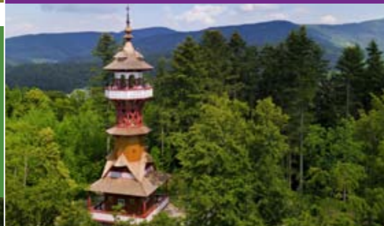
11 - Jurkovičova rozhledna, Rožnov pod Radhoštěm

V letní sezóně je možné využívat venkovní koupaliště ve Zděchově, Velkých Karlovicích, Viganticích, Hutisku - Solanci, Rožnově pod Radhoštěm a Valašském Meziříčí a přírodní koupaliště v Novém Hrozenkově. Oblíbené jsou také splav u autokempingu v obci Hovězí, přehrada Bystřička nebo přehrada na Horní Bečvě.