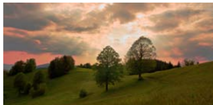
2 - Galovské lúky, Huslenky