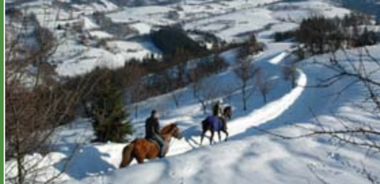
10 - Winterfahrt in der Walchei

Die Besonderheit der Gebiete Horní Vsacko und Rožnov sind Reitpfade, welche hier in einer der wenigen Regionen in der Tschechischen Republik entwickelt wurden. Die Pferde-spazierfahrten kann man zur Zeit in den Ortschaften Hovězí, Janová, Karolinka, Velké Karlovice, Rožnov pod Radhoštěm, Valašské Meziříčí, Valašská Bystřice, Prostřední Bečva und Horní Bečva machen.