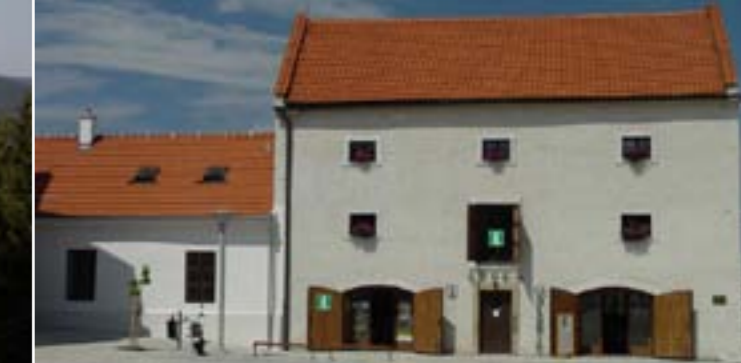
18 - Kultur-Informationscenter, Valašské Meziříčí

Die Auswahl von Unterkünften ist bei uns sehr vielfältig. Sie können in Pensionen, Hütten oder Landhäusern, in Familien- oder großen Luxushotels unterkommen. In den örtlichen Kneipen und Restaurants können Sie traditionelle walachische Gerichte probieren.