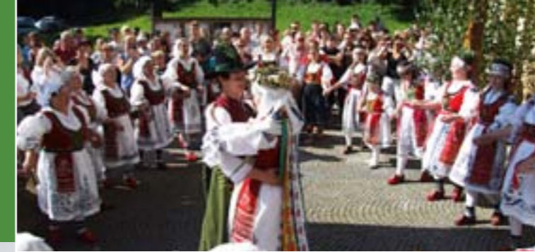
5 - Walachische Hochzeit, Folklorgruppe Hafera, Nový Hrozenkov

Kapellen, Glockentürme, Museen und nicht zuletzt auch erhaltene walachische Holzhäuser, die typisch für alle hiesigen Ortschaften sind.