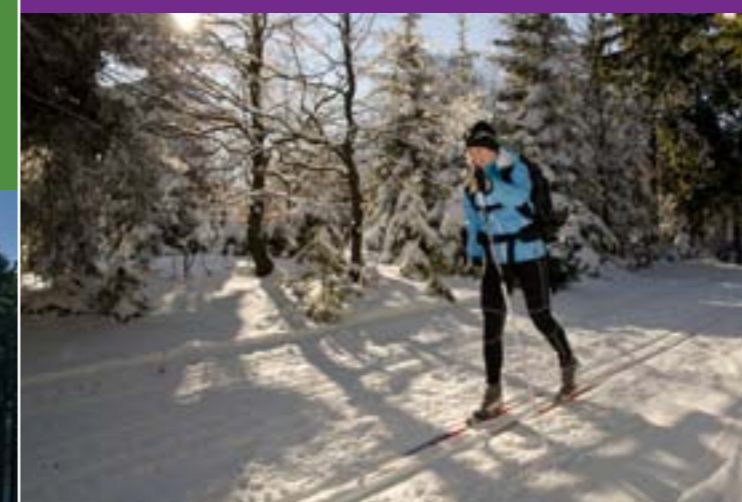
15 - Langlaufspur auf dem Bergkamm des Javorníky Gebirges

Vergessen dürfen wir natürlich nicht den bekannten Radweg Bečva, welcher durch das Tal der Flüsse Rožnovská und Vsetínská Bečva führt.