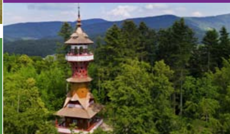
11 - Jurkovič's Aussichtsturm, Rožnov pod Radhoštěm

Die Besonderheit der Gebiete Horní Vsacko und Rožnov sind Reitpfade, welche hier in einer der wenigen Regionen in der Tschechischen Republik entwickelt wurden. Die Pferde-spazierfahrten kann man zur Zeit in den Ortschaften Hovězí, Janová, Karolinka, Velké Karlovice, Rožnov pod Radhoštěm, Valašské Meziříčí, Valašská Bystřice, Prostřední Bečva und Horní Bečva machen.