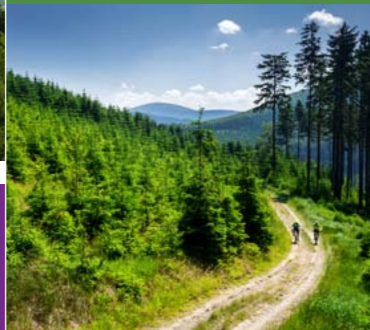
13 - Veřovické Berge mit dem Radhošť im Hintergrund

Dank seinem gegliedertem Gelände ist hier ein dichtes Netzwerk von Wander- und Radwegen. Zu den bekanntesten Gebieten gehört insbesondere die Region der Javorník-Gebirge, Vsetíner Berge, Pustevny, Radhošť und Soláň. Sie können auch Mountainbike-Trails in Velké Karlovice und Zděchov ausprobieren.