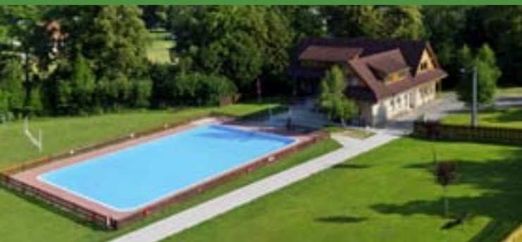
9 - Schwimmbad, Vigantice

In der Sommersaison ist es möglich viele Freibäder zu nutzen, wie in Nový Hrozenkov, Zděchov, Velké Karovitzce, Vigantice, Hutisko-Solanec, Rožnov pod Radhoštěm oder in Valašské Meziříčí. Beliebt ist auch das Wehr bei dem Campingplatz in der Ortschaft Hovězí, der Stausee Bystřička oder der Stausee Horní Bečva.