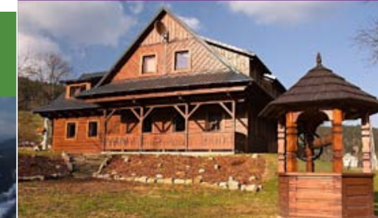
19 - Unterkunft, Velké Karlovice

Die Auswahl von Unterkünften ist bei uns sehr vielfältig. Sie können in Pensionen, Hütten oder Landhäusern, in Familien- oder großen Luxushotels unterkommen. In den örtlichen Kneipen und Restaurants können Sie traditionelle walachische Gerichte probieren.