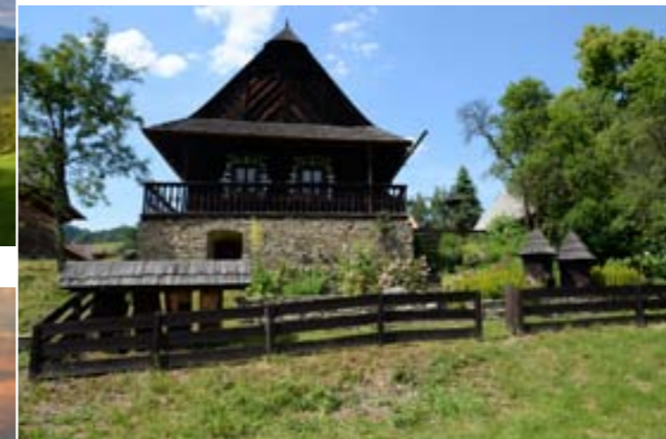
4 - Antonín Strnadel Denkmal, Nový Hrozenkov

Kapellen, Glockentürme, Museen und nicht zuletzt auch erhaltene walachische Holzhäuser, die typisch für alle hiesigen Ortschaften sind.