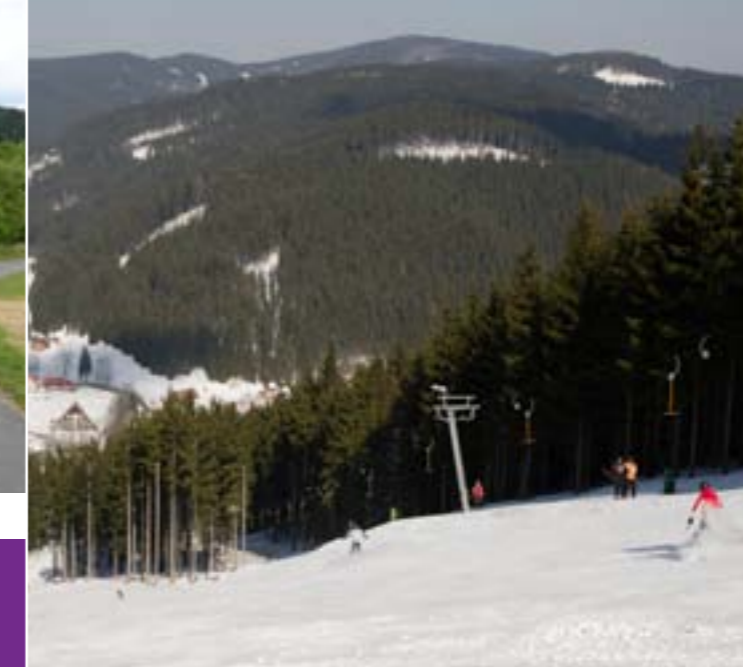
16 - Skiareal Razula

Den Touristen bieten sich in beiden Tälern und dem Bergkamm dutzende Kilometer maschinell hergerichteter Langlauftrassen.