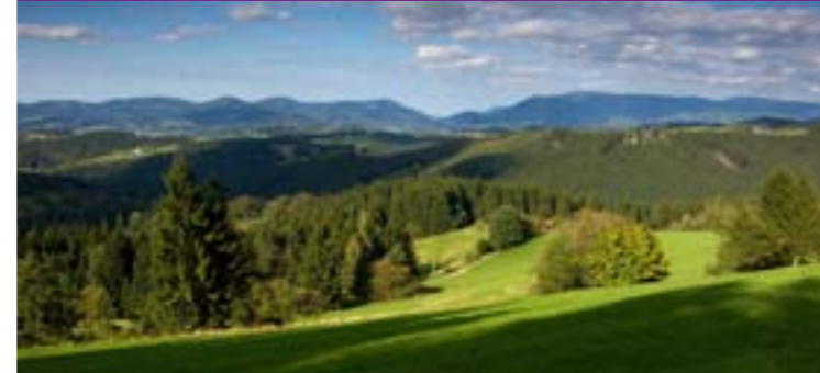
1 - Sicht aus Valašská Bystřice auf den Radhošť

Bei uns finden Sie dutzende Naturschutzgebiete und Reservate, wie z.B. Galovské lúky (Huslenky), Poskla (Hutisko – Solanec), Pod Juráškou (Horní Bečva), Uherská (Zděchov), Stříbrník (Hovězí), Kutaný (Halenkov), Razula (Velké Karlovice), Kudlačena (Horní Bečva) und eine Reihe anderer.