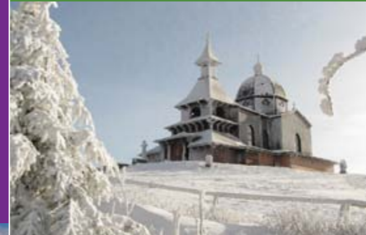
3 - Kapelle des Kyrill und Method, Radhošť

Unsere Region ist wegen seiner kulturellen Sehenswürdigkeiten sehr wertvoll. Es befinden sich hier unzählige Kulturdenkmäler von lokaler Bedeutung mit Merkmalen traditioneller walachischer Architektur. Es handelt sich beispielsweise um Kirchen,