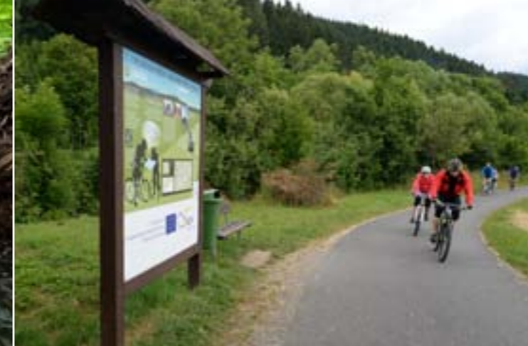
14 - Radweg Bečva, Janová

Vergessen dürfen wir natürlich nicht den bekannten Radweg Bečva, welcher durch das Tal der Flüsse Rožnovská und Vsetínská Bečva führt.