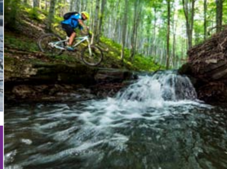
12 - Fluss Jičinka, Veřovické vrchy

Zu den ausgesuchten Plätzen der Touristen gehören ebenso Aussichtstürme. Im Gebiet Hornovsacko befinden sich die Aussichtstürme Miloňová, Sůkenická und Ztracenec. Bei Rožnovsko steht Jurkovič's Aussichtsturm und weitere auf den Bergen Velký Javorník und Bůřov. Hier gibt es unzählige Orte mit wunderschönen Ausblicken.