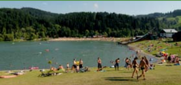
8 - Naturschwimmbad, Nový Hrozenkov

Das Touristengebiet „Meine Walachei“ bietet sehr gute Bedingungen für eine aktive Freizeitgestaltung. Genau dieser Charakter der Landschaft mit seiner hochwertigen und reichhaltigen Infrastruktur des Fremdenverkehrs und die urwüchsige Volkskultur ziehen viele Touristen in die Walachei. Vorwiegend kommen die Touristen zum Radfahren und Wandern hierher. Im Winter zum Skifahren, Langlaufen oder Schneeschuhwandern.