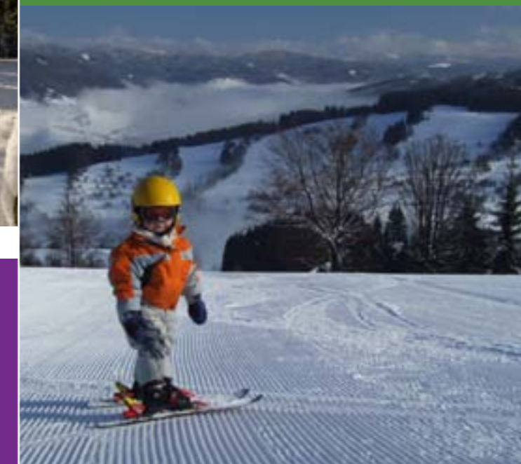
17 - Skilift Vranča, Nový Hrozenkov

Die Skiresorts bieten verschiedenste Schwierigkeitsgrade ihrer Pisten mit Skiliften unterschiedlichster Längen an.