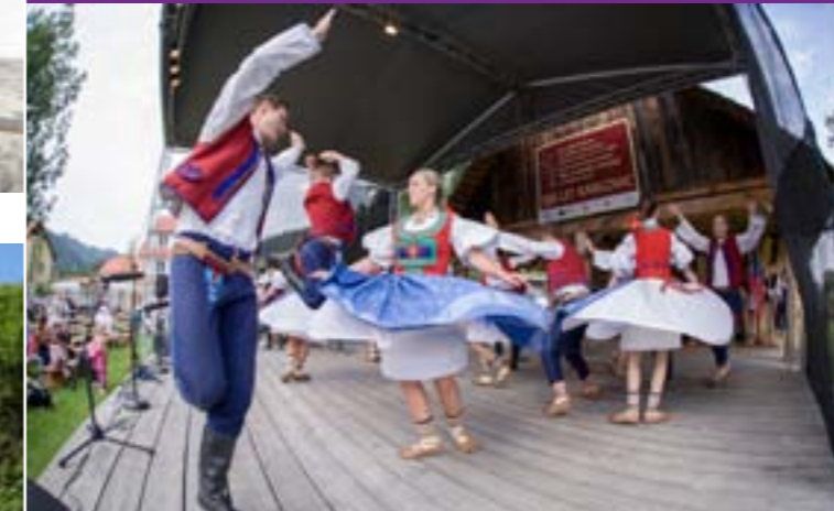
6 - Fest zum 300 Jahre alten Jubiläum der Ortschaft Velké Karlovice

Das ganze Jahr herrscht hier ein munterer Kulturrummel in Form von traditionellen Aktionen, wie z.B. Jahrmärkte, Kirmessen, Festivals, Konzerte und Auftritte, Ausstellungen, Vorlesungen oder Theatervorstellungen.