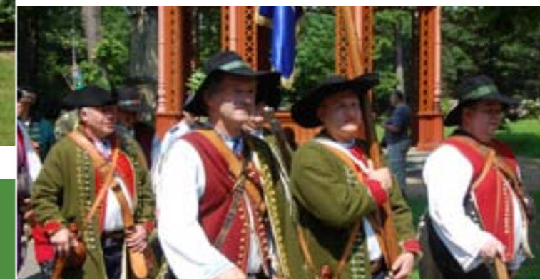
7 - Portáš Feiern, Valšská Bystřice

In sieben Ortschaften befinden sich Informationszentren für Touristen, in Karolinka, Nový Hrozenkov, Velké Karlovice, Zašová, Valašská Bystřice, Rožnov pod Radhoštěm und Valašské Meziříčí.